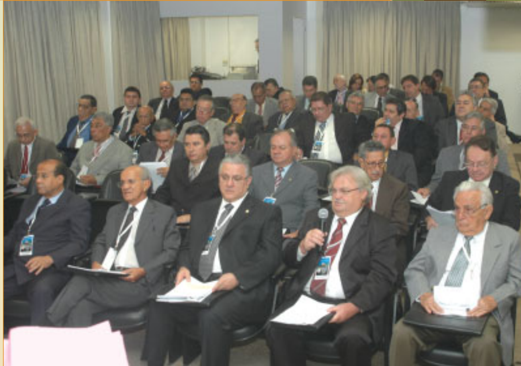
Vista do Plenário que elegeu o novo Presidente do CONFERE